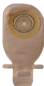
Alterna Free nyitott

Alterna urosztómás zacskók vizeletürítő csőve puha műanyagból készül, amely biztonságos dugóval egyszerűen zárható.