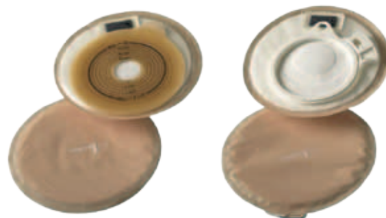
sztómasapkák elől- és hátulnézetben

Ez a kisméretű eszköz bőrszínű, szagzáró, lágy filmanyagból és többrétegű, beépített szagszűrővel készül. A zajcsökkentő betétlap magába szívja a sztómából esetlegesen ürülő váladékot. Választható egyrészes öntapadó vagy kétrészes típus.